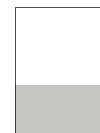
1/3 Seite quer