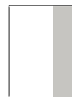
1/3 Seite hoch